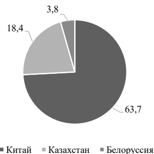
Рис. 3. Доля импорта новых легковых автомобилей в разрезе стран в декабре 2022 года, в %

Статья поступила в редакцию 20.06.2023; одобрена после рецензирования 29.06.2023; принята к публикации 05.07.2023.